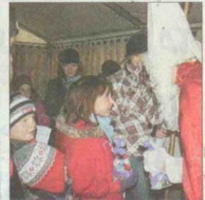
Wenn die Kinder auch schön brav waren, verteilte der Nikolaus kleine Geschenke.