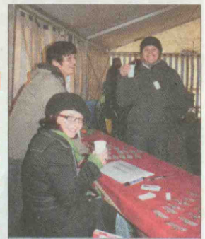
Das agento-Team kümmerte sich um die Gäste und um die Verpflegung.