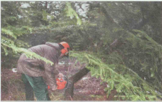
Ein professionelles Team sorgte für das Fällen des ausgesuchten Christbaumes.