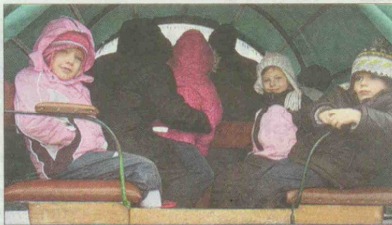
Besonders für die Kleinen war die Kutschfahrt ein Erlebnis.