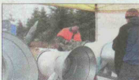
Zuerst wurde der Baum in die richtige Form gebracht und der Wunschhöhe angepasst und dann ging es an das „Eintüten“.