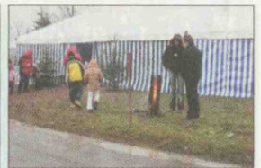
Ein Zelt und Schwedenfeuer sorgten für Wärme.