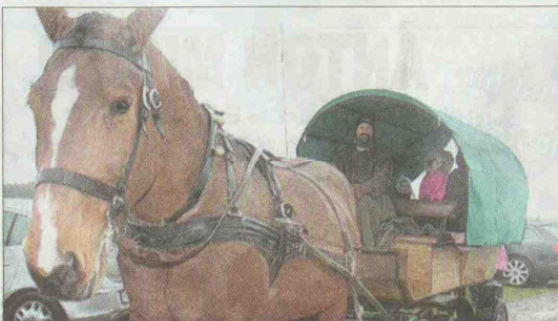
Ein Highlight: Die Fahrt mit der Pferdekutsche.